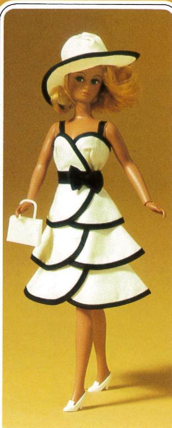
1734 „Rio“ – weißes Sommerkleid mit 3-stufigem Rock, dazu passender Hut, Gürtel, Handtasche und Pumps.