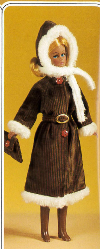
1751 An kalten Tagen trägt KARINA einen dunkelbraunen Cordmantel mit weißem Pelzbesatz. Dazu Cordkaputze, Cordtasche und Stiefel.