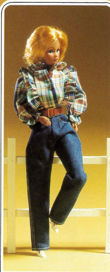
1709 „Zum Pferde stehen“: Lässige Jeans mit romantischer Volantbluse, Handtasche und Schuhe.