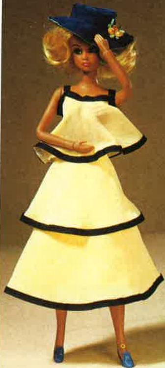
1708 Elegantes, 2-teiliges Georgette- Kleid mit Hut und Schuhen