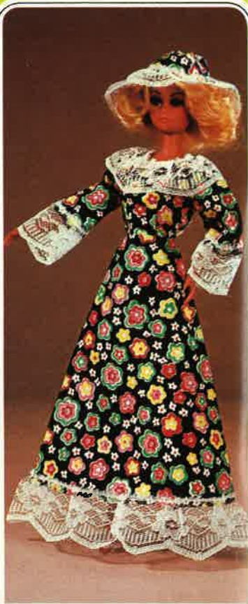
1629 Langes, buntes Kleid mit Spitzen- besatz, passendem Hut, Pumps, Kleiderbügel