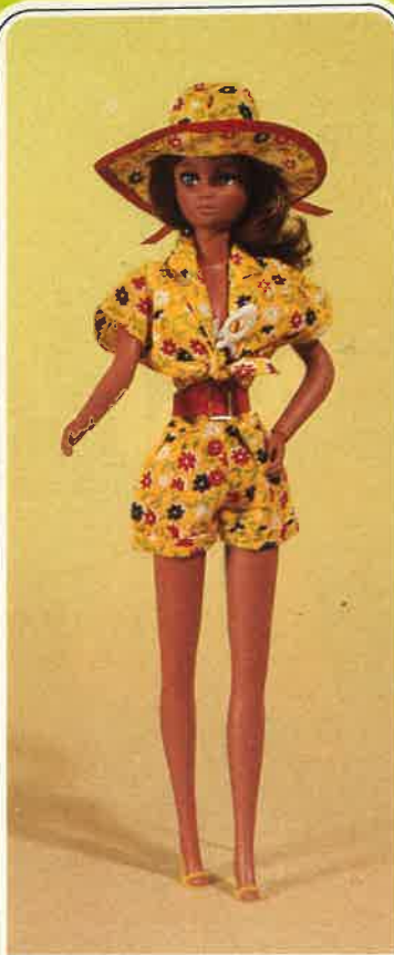
1619 Modischer Stranddress: Bundfal- ten-Shorts mit Gürtel und kurzer Hemdbluse (zum Verknoten), mit Hut, Sonnenbrille und Sandaletten.