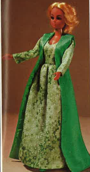
1743 Hochelegantes Brokatkleid mit ärmellosem Mantel und Schuhen