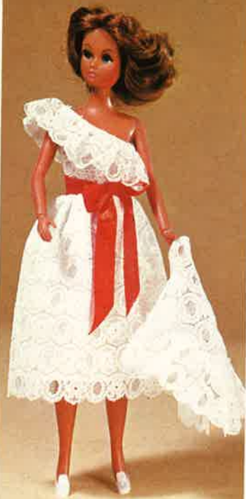
1709 Traumhaft schönes Spitzenkleid (schulterfrei) mit Dreiecktuch