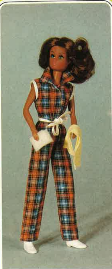
1645 "Car-Wash" schicker Overall aus buntem Karostoff. Dazu Gürtel sowie Autowash-Utensilien, wie Schwamm und Tuch, wasserdichte Gummischeue.