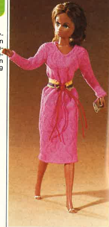
1617 Raffiniertes, schmal geschnittenes Kleid in der Modefarbe pink, mit hübschem Folklore-Gürtel, silbernes Abendtäschchen und Pumps.

Mode, die nicht viel kostet. Mit city-chic-Modellen ist KARINA zu allen Gelegenheiten immer hübsch angezogen. Die auf den Fotos abgebildeten Accessoires, sowie ein Kleiderbügel sind in der Packung enthalten.