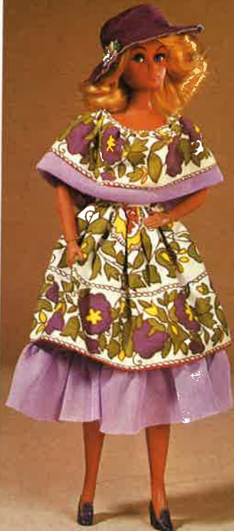
1704 Schickes Tanzkleid mit Volant und passendem Hut, Schuhe