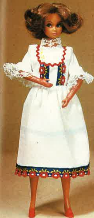
1705 Elegantes Dirndl-Kleid mit spitzen- besetzter Bluse, Schuhe