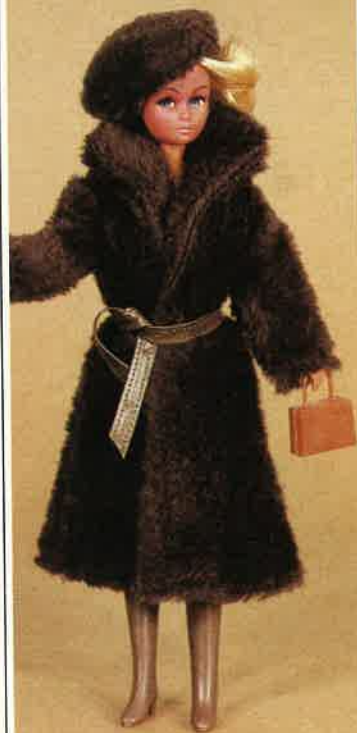
1715 Eleganter Pelzmantel mit Gürtel, passende Fellmütze, Handtasche und Stiefel.