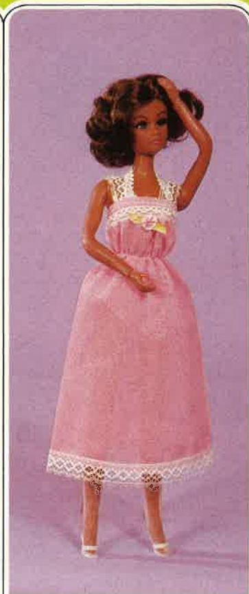
1633 Elegantes Diolen-Nachthemd mit Spitzen verziert, dazu passendes Höschen und BH sowie 2 Paar Strümpfe (hell und dunkel), Pumps.