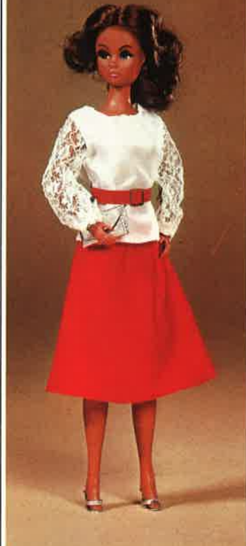
1622 Spitzenbluse mit Cocktailrock, Gürtel, silberne Pumps und silbernes Abendtäschchen, Kleiderbügel