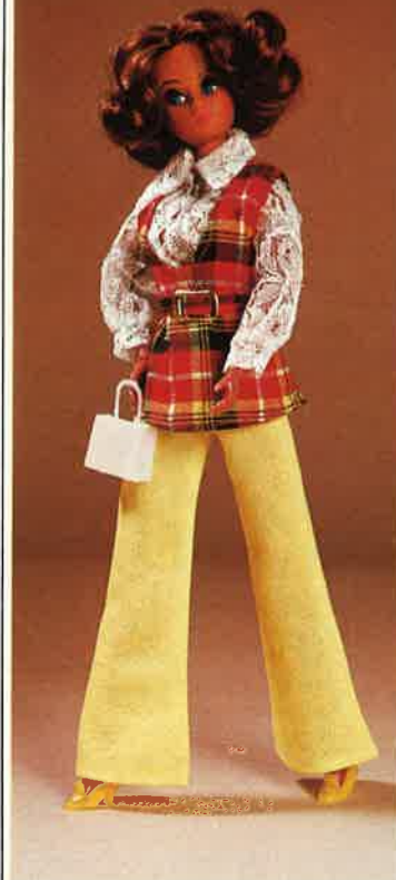
1621 Hose, Weste, Spitzenbluse, Schuhe und Handtasche, Kleiderbügel

Farb- und Materialänderungen vorbehalten.