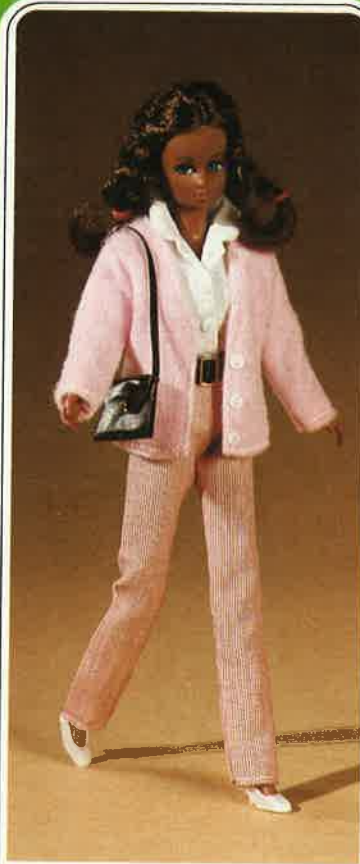
1719 Umwerfend chic: Rot-weiß-gestreifte Röhrenjeans mit schwarzem Gürtel, weiße Hemdbluse und darüber ein weiches, rosafarbiges Angorajäckchen. Schultertasche und Schuhe.