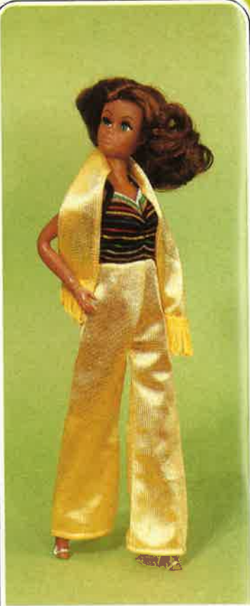
1647 Eleganter, einteiliger Satin-Overall, rückenfrei, mit buntem Lurex-Oberteil. Dazu passender Satinschal mit Fransen, Abendtasche und Pumps.