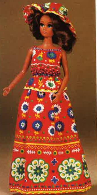
1741 Garten-Party-Kleid im Bauernlook, 2-teilig, mit Hut und Schuhen