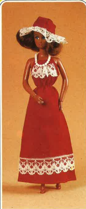
1649 Rückenfreies Partykleid aus Baumwollstoff mit Spitze verziert. Hut aus gleichem Material, Perlenkette und Pumps.