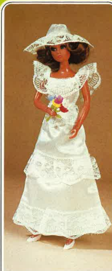
1631 Brautkleid mit Spitzenhut, Schuhe Blumenbouquet, Kleiderbügel