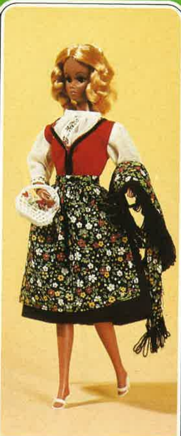
1720 Original-Dirndl-Kleid mit eng anliegendem Oberteil und Glockenrock. Darunter eine zarte Bluse mit Blümchenbordüre. Dazu bunt geblumte Schürze mit passender Fransenstola.