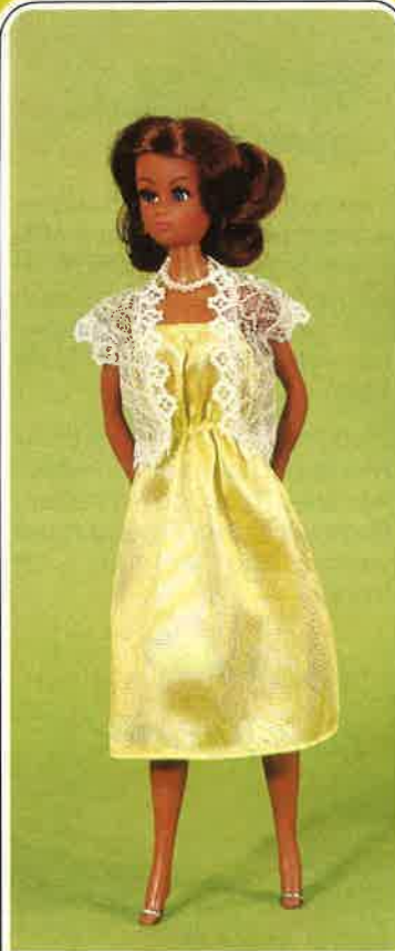
1648 Attraktives Cocktailkleid aus Satin, schulterfrei und in der Taille leicht angekraust, dazu Spitzenjäckchen (mit Silberfäden durchzogen) sowie Perlenkette, Abendtasche und Pumps.