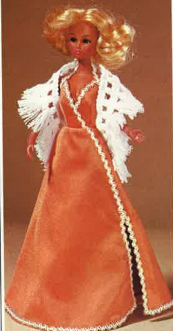
1744 Tiefdekoltiertes Abendkleid, rückenfrei mit seitlichem Schlitz, Stola und Schuhen