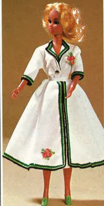
1706 Attraktives Trachtenkostüm mit schwungvollem Glockenrock, Schuhe