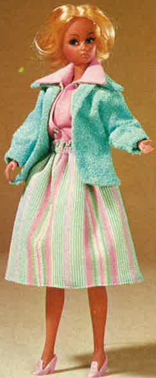
1703 Reizende 3-teilige Kombination: Boucléjacke mit weitem Rock und Hemdbluse, Schuhe