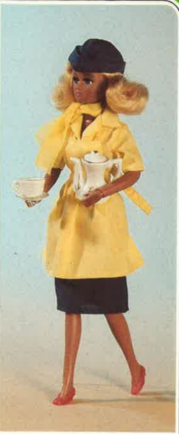
1721 KARINA als Stewardess! Komplette Stewardessengarnitur: Marineblaues Kostüm mit schmalen Rock, Blazer und Schiffchen. Gelbe Halbarm-Hemdbluse und Chiffon-Schal. Zum Servieren modische Stewardessen-Schürze. Außerdem Schultertasche, Koffer und Schuhe.