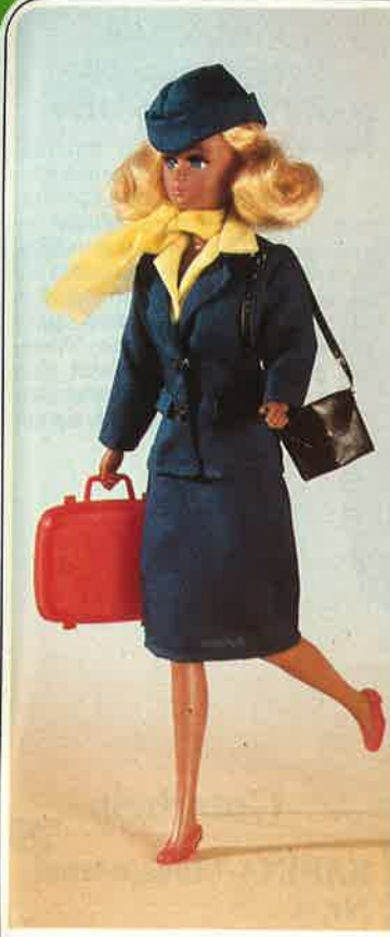
1721 KARINA als Stewardess! Komplette Stewardessengarnitur: Marineblaues Kostüm mit schmalen Rock, Blazer und Schiffchen. Gelbe Halbarm-Hemdbluse und Chiffon-Schal. Zum Servieren modische Stewardessen-Schürze. Außerdem Schultertasche, Koffer und Schuhe.