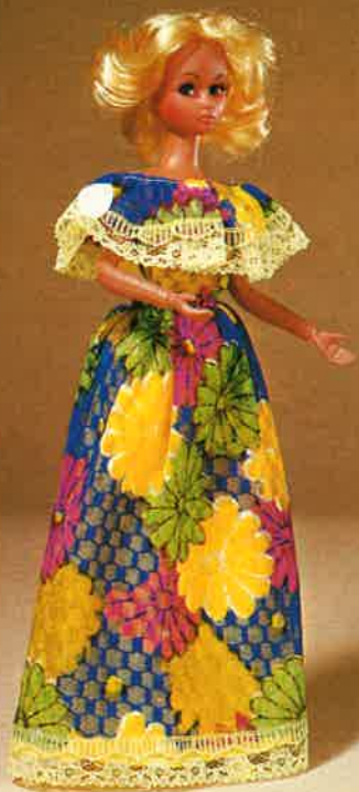
1710 Duftiges Partykleid (2-teilig) mit Spitzenbesatz, Schuhe