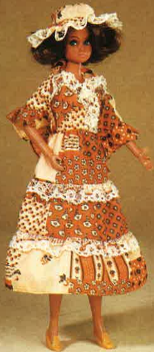
1707 Reizendes, rückenfreies Folklore- kleid mit Dreiecktuch und spitzen- besetztem Hut, Schuhe