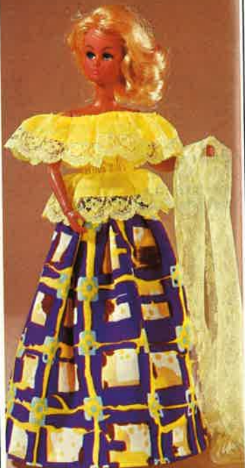
1742 Angekrauster, langer Partyrock mit trägerloser Volantbluse und Spitzenstola, Schuhe