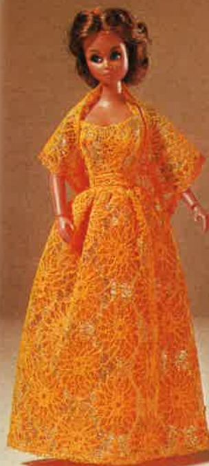
1711 Schicker Party-Dress aus Spitzen- brokat, 3-teilig, mit Schuhen